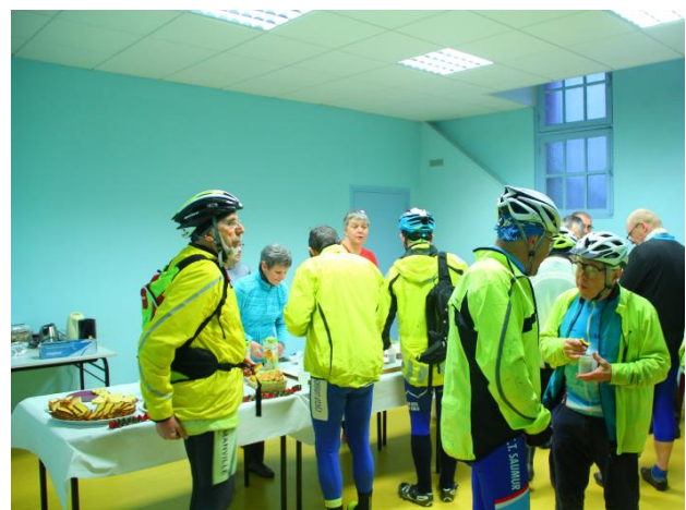
un peu de réconfort avant d'affronter pluie et bosses