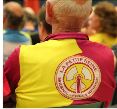
Un si joli nom