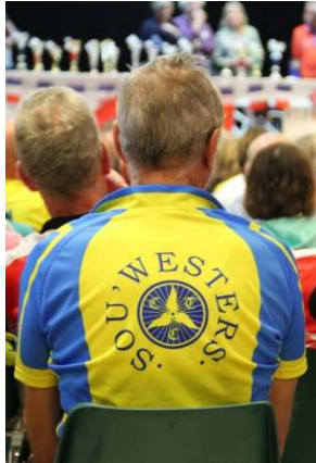
Un club venu en force