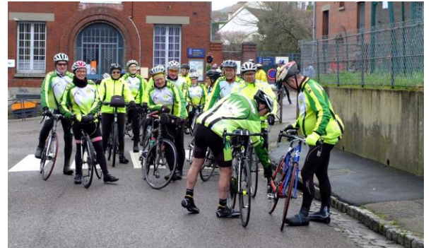
Normanville , le club le plus représenté

9h. Tandis que s'éloignent nos valeureux cyclos, nous nous attaquons à la préparation des casse-croûtes. Chargement des véhicules, direction La Saussaye où des particuliers amis du GTR nous ont généreusement ouvert leur jardin.