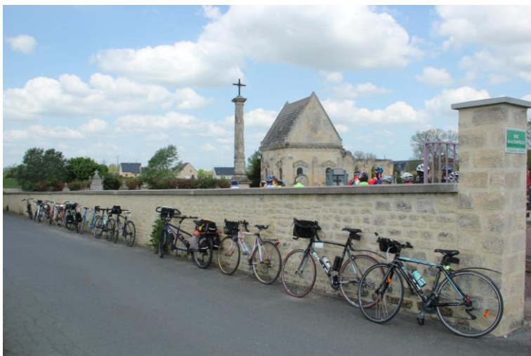
vestiges d'une chapelle sépulcrale (17ème siècle)