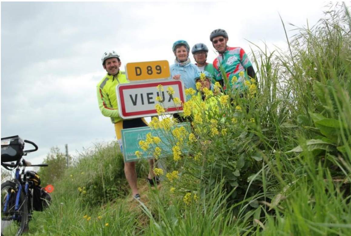
des jeunes à Vieux !