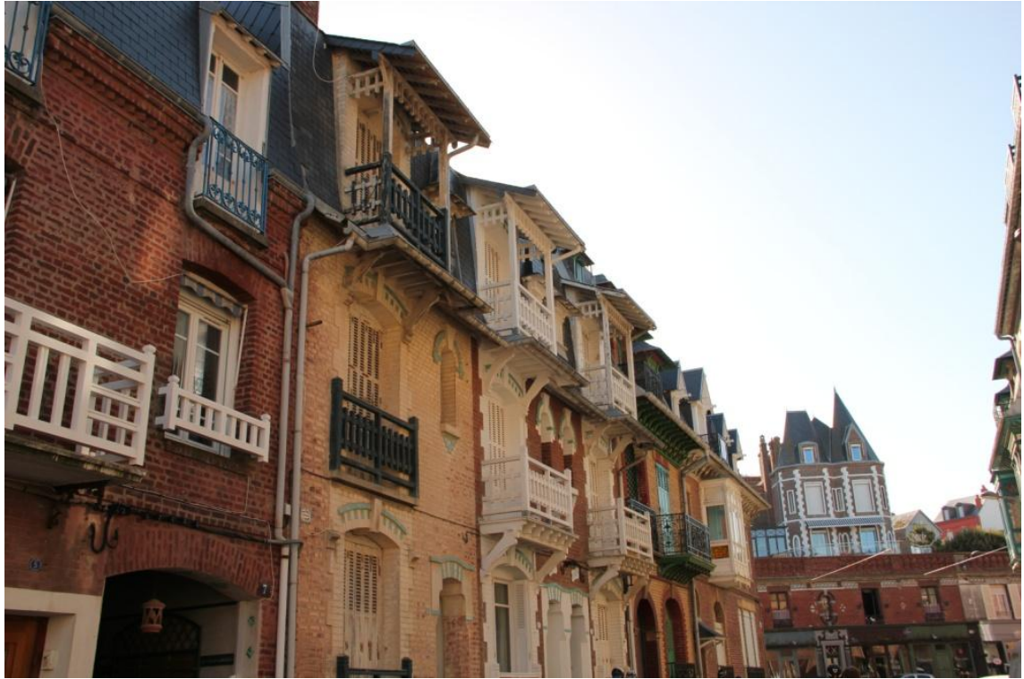
Un peu plus loin, une balade à Mers-les-Bains s'impose. Nous y admirons les jolies et colorées villas balnéaires. Nous sommes entrés en Picardie : une borne symbolise la frontière.