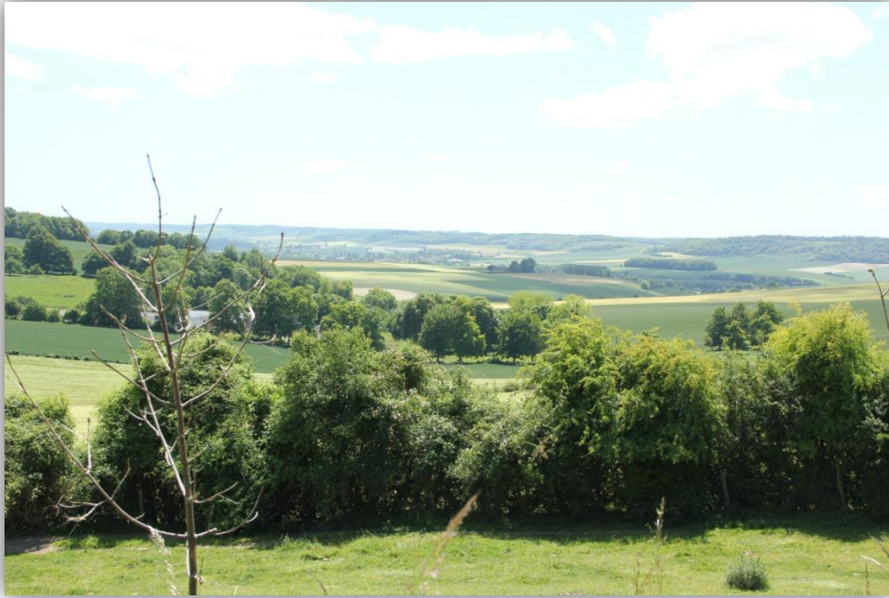
Nous reprenons la route à travers des paysages vallonnés.